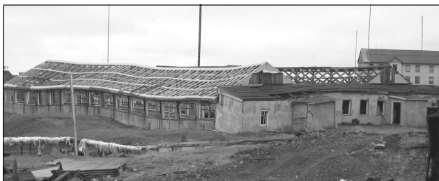
Abb.2: Durch Thermokarst verbogene Treibhausruine in Tiksi (sibirische Arktis).

Als Grundlage für diese Aussage dienen unzählige Daten und wissenschaftliche Erkenntnisse. In den letzten Jahren sind keine Forschungsergebnisse publiziert worden, die den Einfluss der Menschheit auf das Klima in Frage stellen. Im Gegenteil, die o.g. Fakten werden weiter erhärtet. Gelegentlich werden in der Presse gegenteilige Aussagen verbreitet, die jedoch nicht in begutachteten wissenschaftlichen Fachzeitschriften veröffentlicht worden sind. Außerdem finden oft auch »Gespensterdiskussionen« in den Medien statt, die losgelöst von den wissenschaftlichen Fakten sind und zur Verwirrung und Desinformation der Öffentlichkeit führen.