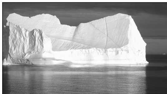
Abb.1: Eisberg, Disko-Bucht, Grönland.

Auch im globalen Strahlungshaushalt hat das polare Eis eine herausragende Bedeutung. Die Albedo des Eises, d.h. das Reflexionsvermögen gegenüber der Sonneneinstrahlung im sichtbaren Wellenlängenbereich (0,4–0,7 µm), liegt zwischen 0,5 (schneefreies bzw. schmelzendes Eis) und 0,85 (mit Neuschnee bedecktes Eis), während die Albedo des eisfreien Ozeans unter 0,1 liegt. Das bedeutet, dass die Eisdecke den Eintrag an kurzweiliger Strahlungs-