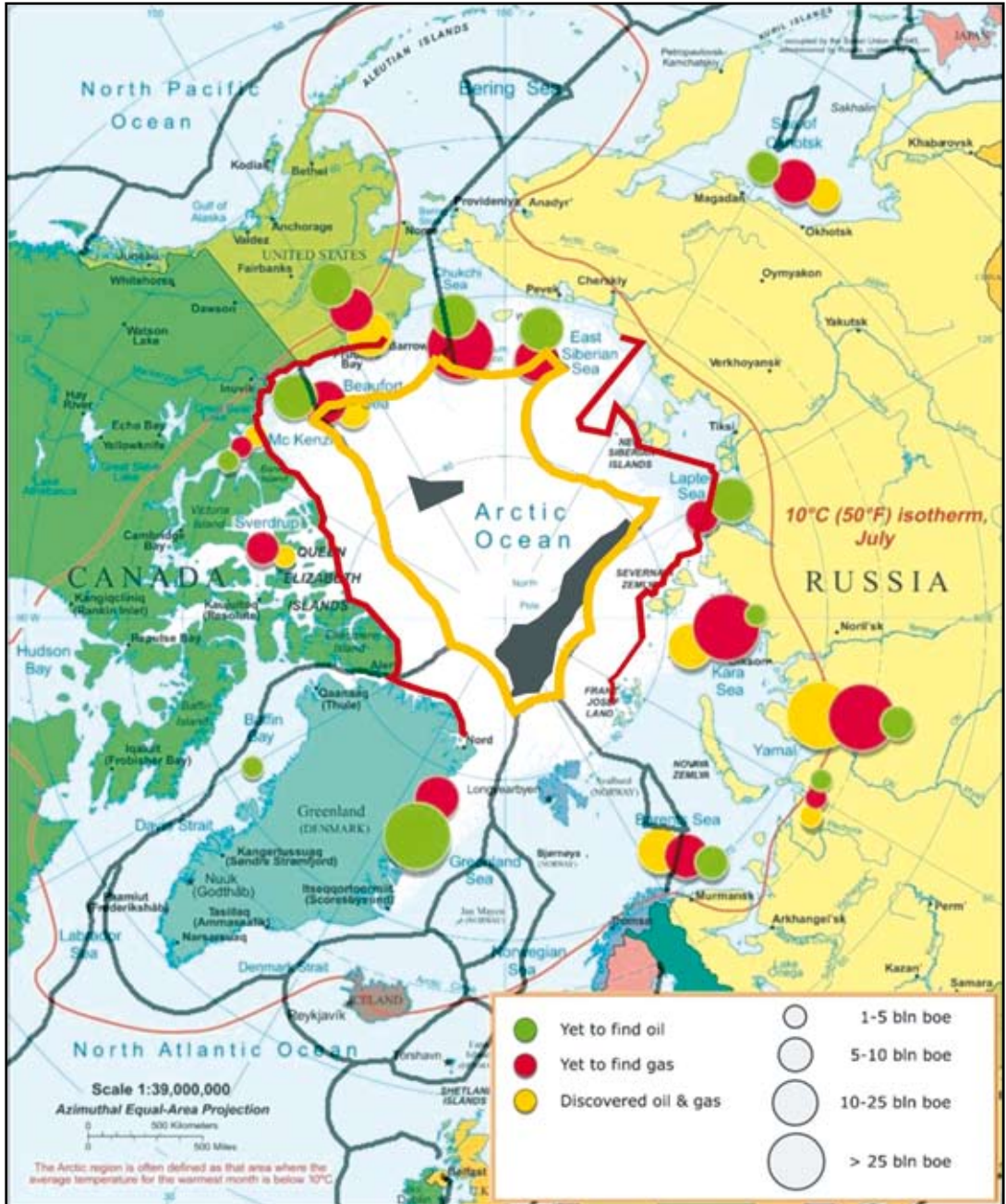
Abb. 4.9-2: Aufteilung des arktischen Ozeans im Extremfall der Anerkennung sog. »unterseeischer Erhebungen« gemäß Art.76 (6) UNCLOS nach MacNab et al. 2000. Rote Linien - Küstenbasislinie. Gelbe Linie - äußere Begrenzung der jeweiligen AWZ. Nur die grauen Flächen verbleiben in diesem Fall in internationaler Verwaltung durch die Internationale Meeresbodenbehörde.

dem Lomonosow-Rücken, einem Kontinentfragment, das sich vor ca. 50 Mill. Jahren vom eurasischen Kontinent abgespalten hat, befinden. Um sie aufzuspiüren und sogar zu fördern sind in mehreren Schritten ungewohnte Investitionen erforderlich, die auf absehbare Zeit